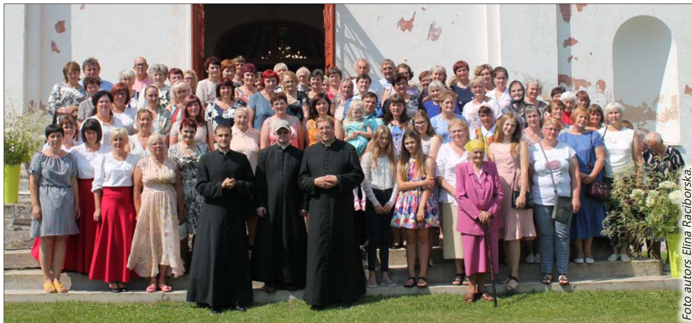
Bēržu Svētās Annas Romas katoļu draudzes svētku apmeklētāji.

Bēržu Sv. Annas Romas katoļu draudzes svētku apmeklētāja