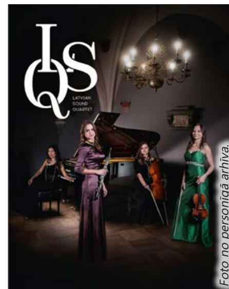
Latvian Sound Quartet.

Koncertprogramma veidota kā neliels teatrāls uzvedums ar galma atmosfērai raksturīgu atribūtiķu - parūkām, tērpiem un grimu. To piedāvā Latvian Sound Quartet - četras jaunas, mērķtiecīgas, talantīgas un enerģiskas mūziķes, kuras kopā muzicē sešus gadus. Kvarteta sastāvs ir īpašs un reti sastopams, tā repertuāru veido tam īpaši veidoti jaundarbi, kā arī labi zināmu skaņdarbu aranžējumi.