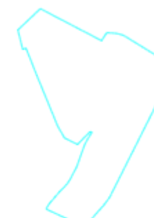
Projektētās teritorijas shēma pēc zemes ierīcības projekta izstrādes