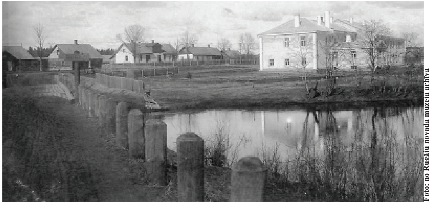
Rugāju sešklasīgā pamatskola no Rēzeknes ceļa puses apmēram 1936. gadā.