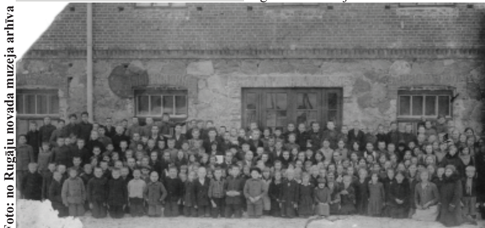
Foto no 1934. gada, kad skola pārcēlās uz jauno, vēl līdz galam nepabeigto skolas ēku.

1944. gada rudenī izveidoja Rugāju nepilno vidusskolu, vēlāk – Rugāju valsts nepilno vidusskolu, tad – Rugāju vidusskolu. Vecākajās klasēs mācījās jaunieši ne tikai no Rugāju pagasta, bet arī no Bērzpils, Tilžas, kur