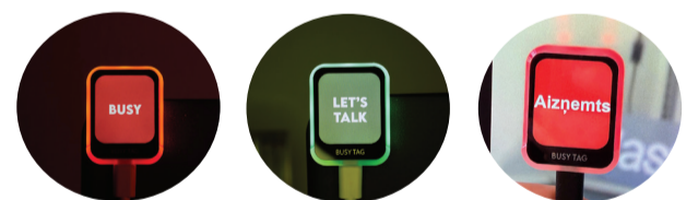
© Produkts "Busy Tag" | busytag.com

“TOMĒR IKVIENAM, KURŠ DOMĀ PAR BIZNESU UZSĀKŠANU, NOTEIKTI VAJADZĒTU MĒGINĀT - LAI "NODĒDZINĀTU" IEKŠĒJO VĒLMI, GŪTU PIEREDZI UN SAPRASTU, VAI UZŅĒMĒJDARBĪBA IR PIEMĒROTA. JA NEIZDODAS, VIENMĒR IESPĒJAMS ATGRIEZTIES DARBĀ PIE CITA UZŅĒMĒJA VAI VALSTS UN PAŠVALDĪBU SEKTORĀ.